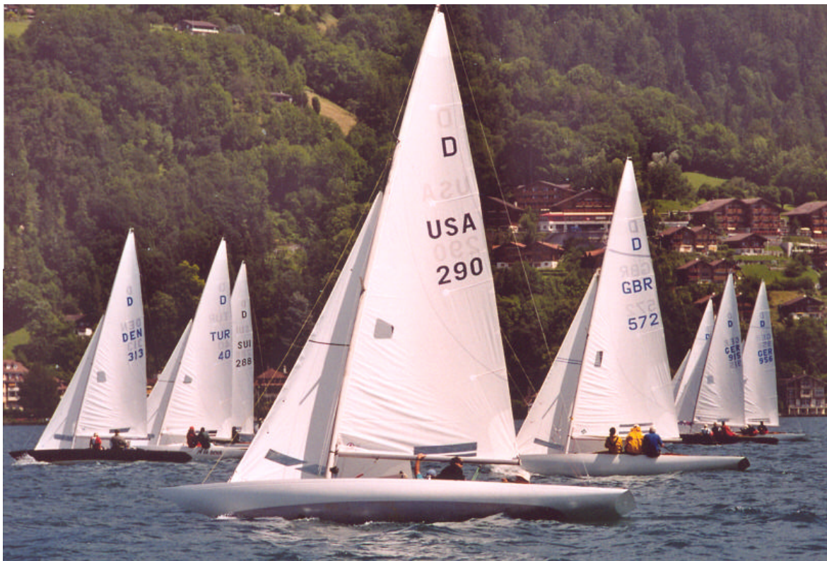
Europameisterschaft 2002, Thunersee-Yacht-Club

Weil der Drachen so weit verbreitet ist und so leicht transportiert werden kann, herrscht an den Regatten die kosmopolitischste Atmosphäre, es werden Freundschaften über nationale Grenzen hinweg geschlossen oder aufgefrischt.